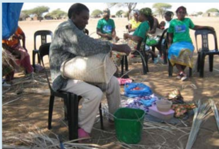
Formation dans la production des produits artisanaux

pluie et la production des produits artisanaux. Grâce à ces formations et à la mise en œuvre de ce qu'il y a appris, il a contribué au développement social et économique de son village. Depuis quelque temps, il donne aussi des formations sur des sujets divers et, de cette manière, transmet son savoir avec plaisir aux autres partenaires de la communauté.