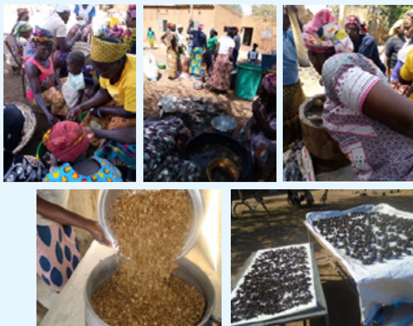
Des photos : Atelier de fabrication de soubala

Au cours de 4 ateliers, 240 femmes ont été formées à la transformation des graines de néré ( Parkia biglobosa ) en épices alimentaires, très répandues au Burkina Faso (par ex. Soubala) et dont la production génère des revenus pour les femmes.