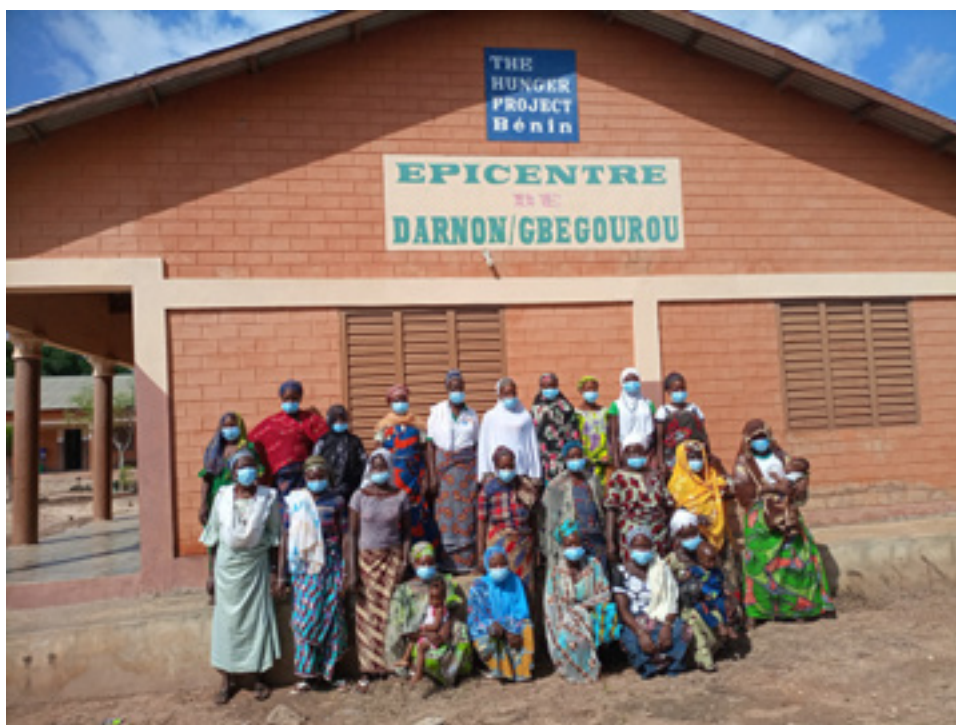
Photo : Participantes à la formation sur la microfinance

Grâce à cet investissement supplémentaire dans le domaine de la microfinance, les épices centres de Gbégourou et de Sonon-Guinagourou au Bénin ont atteint l'autonomie en 2021.