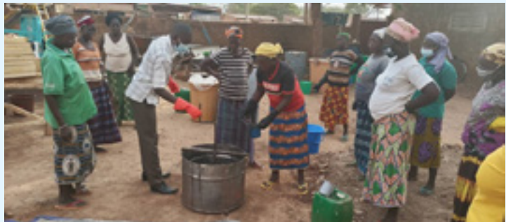
Photos : formation à la production de savon

4 ateliers ont contribué à renforcer les capacités de 200 femmes dans la production de savon. Ce renforcement des capacités a permis aux femmes d'améliorer la qualité et la présentation de leur production. Cela leur permettra de conquérir d'autres marchés.