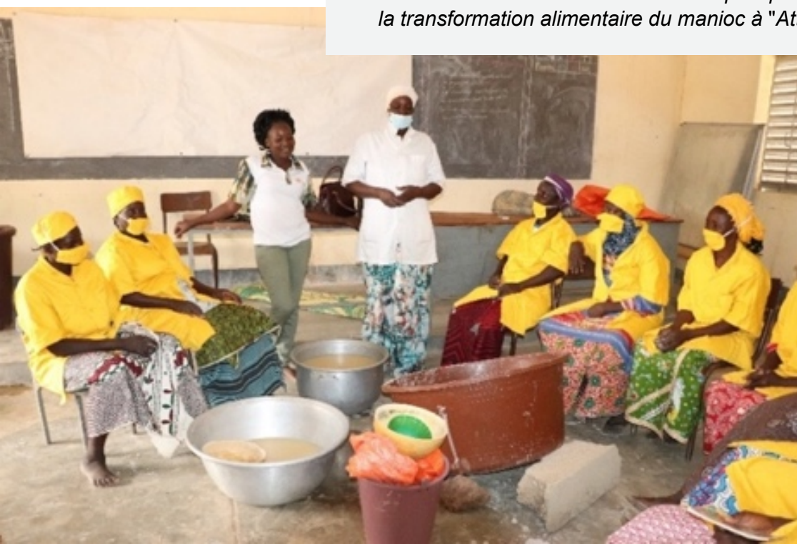
Comité directeur des unités économiques pour la formation à la transformation alimentaire du manioc à "Attiéké"

Par ailleurs, les capacités économiques, organisationnelles et de gestion ont été renforcées grâce à des formations et des équipements. Enfin, l'accès des ménages aux services de financement a été amélioré. Les communes sont confiantes quant à la poursuite des initiatives après l'autonomie. Elles prévoient même d'étendre leurs activités à des villages et communes voisins.