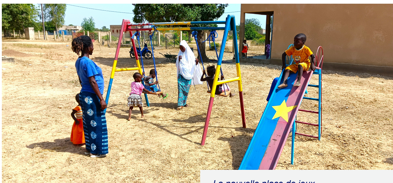
La nouvelle place de jeux

Contributions personnelles : Tous les membres du comité et les animateurs/trices travaillent bénévolement et transmettent leurs connaissances à d'autres villageois.